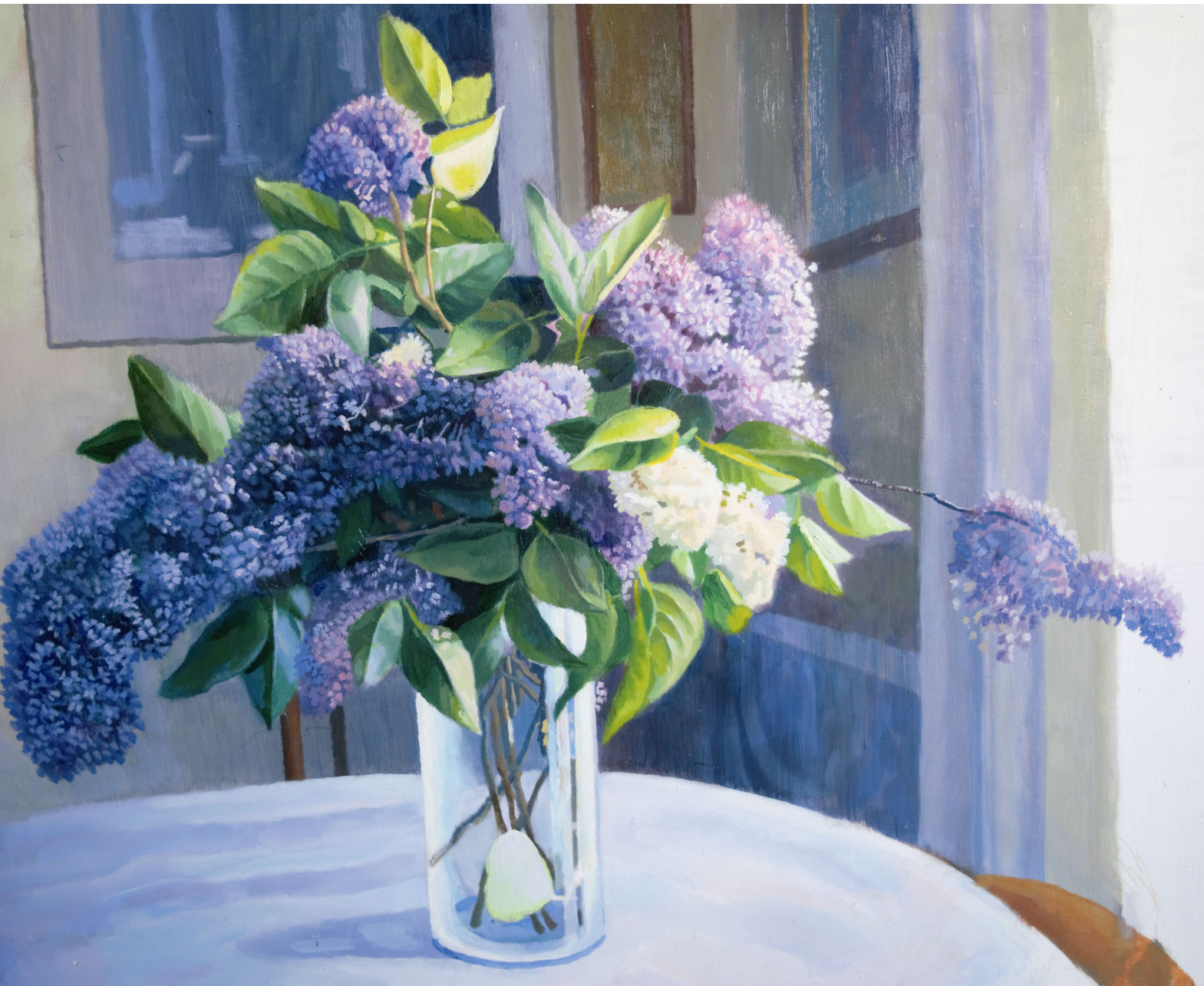
Lilas óleo sobre tabla 80x65