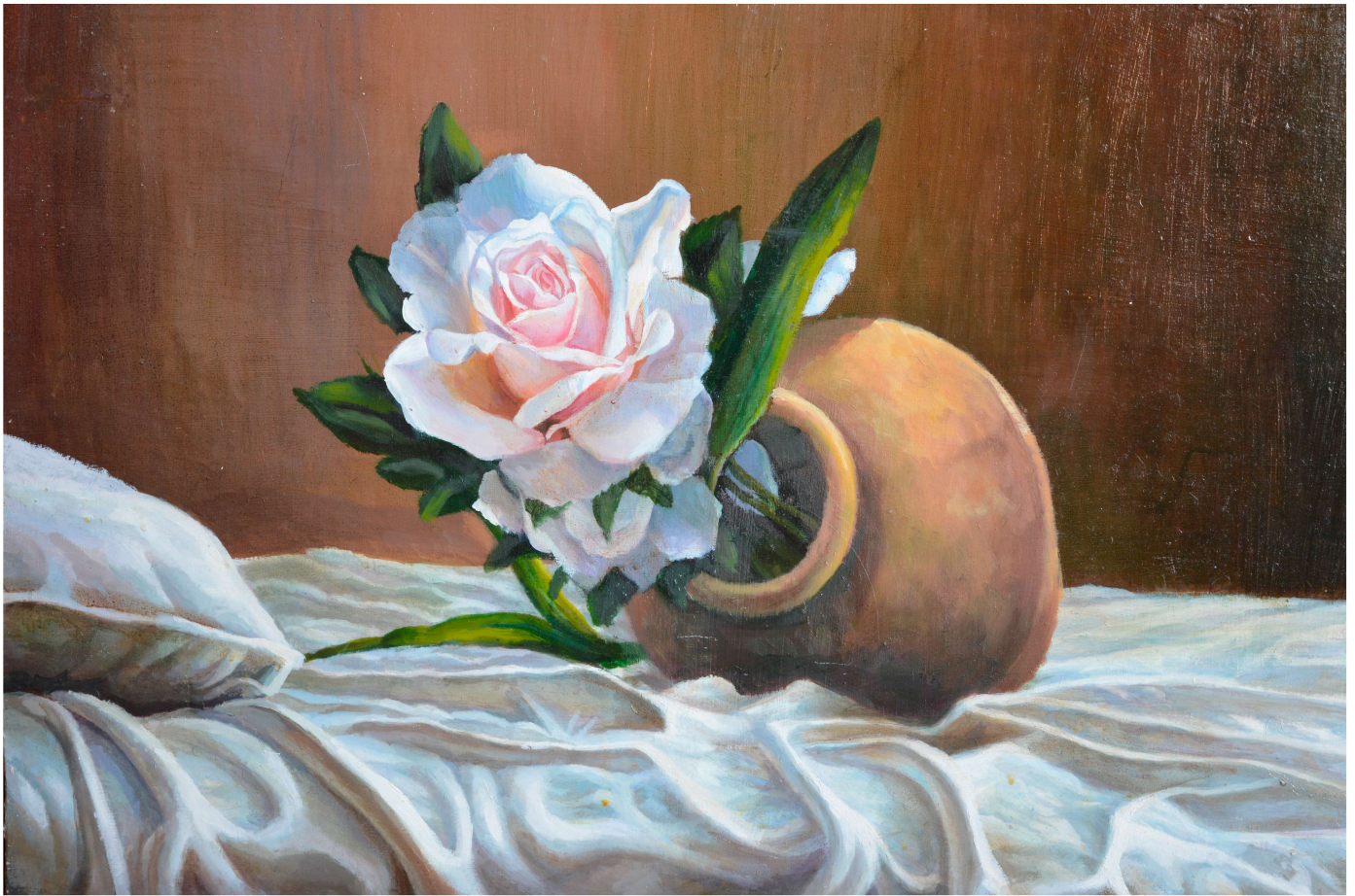
Cama y flor Óleo sobre tabla 80x65