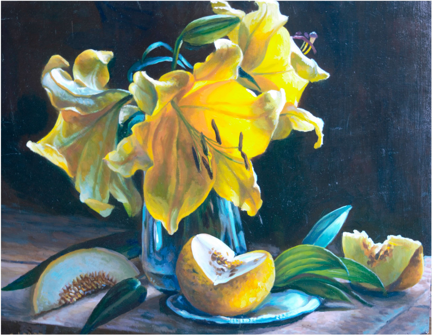
Flor amarilla Óleo sobre tabla 80x65