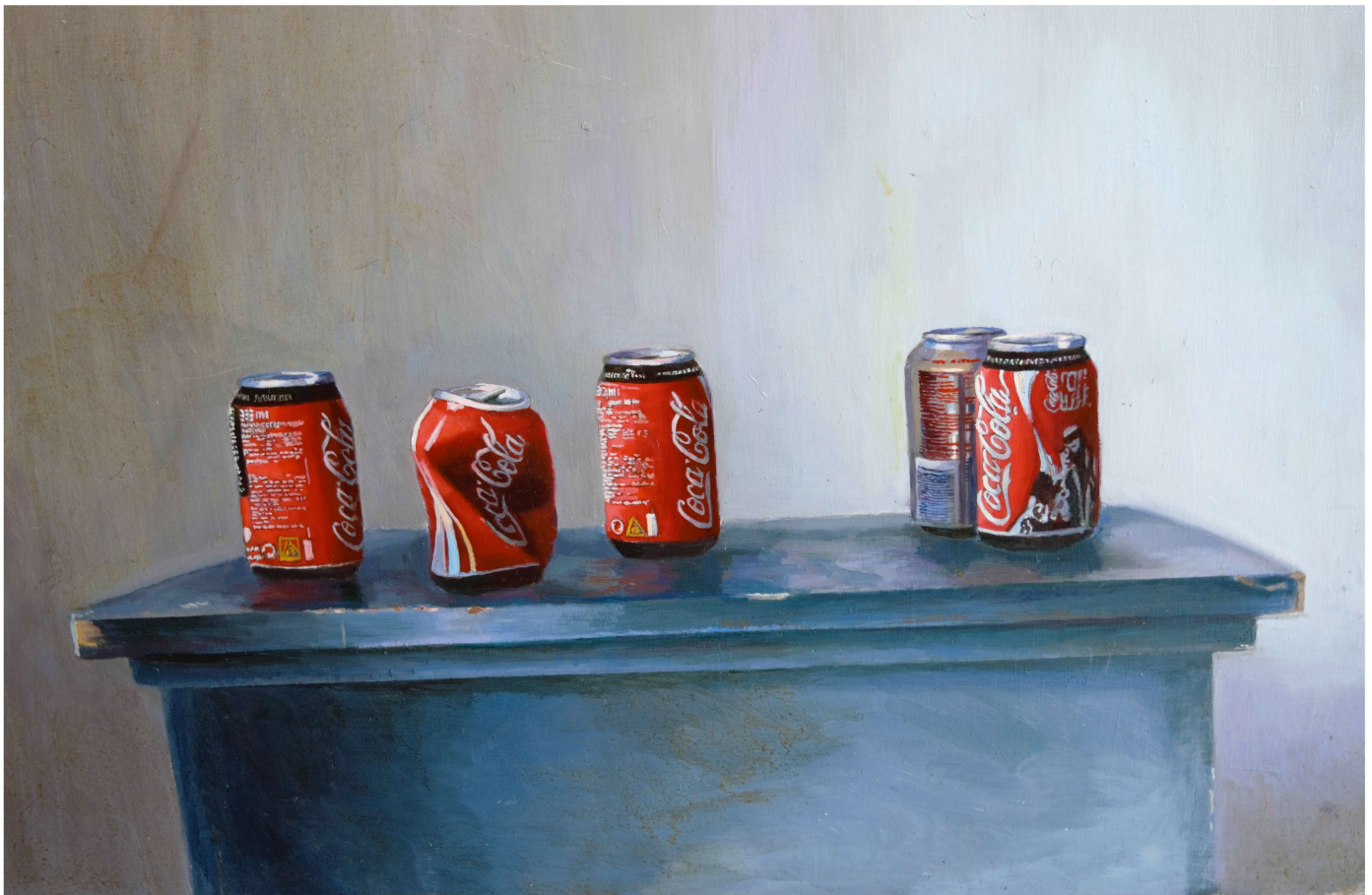
Cocacolas Óleo sobre tabla 80x65