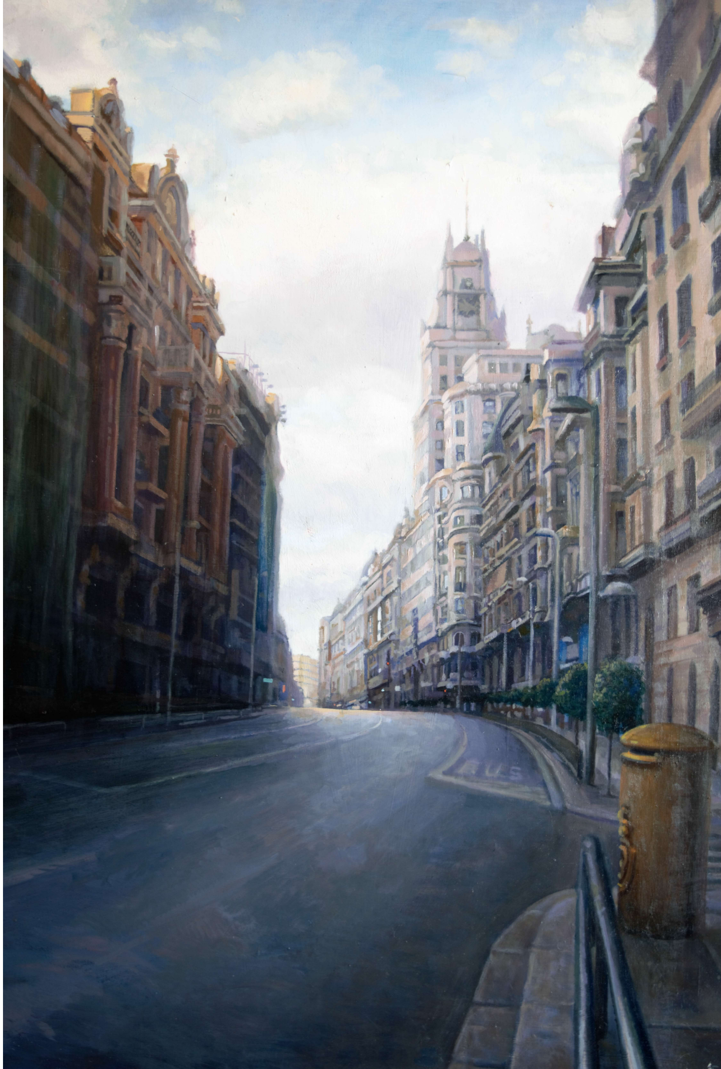
Ciudad óleo sobre tabla 100x81