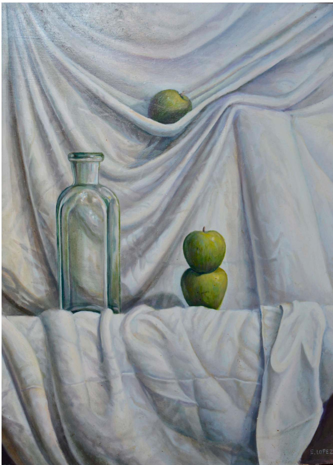
Sábana y manzanas Óleo sobre tabla 100x81