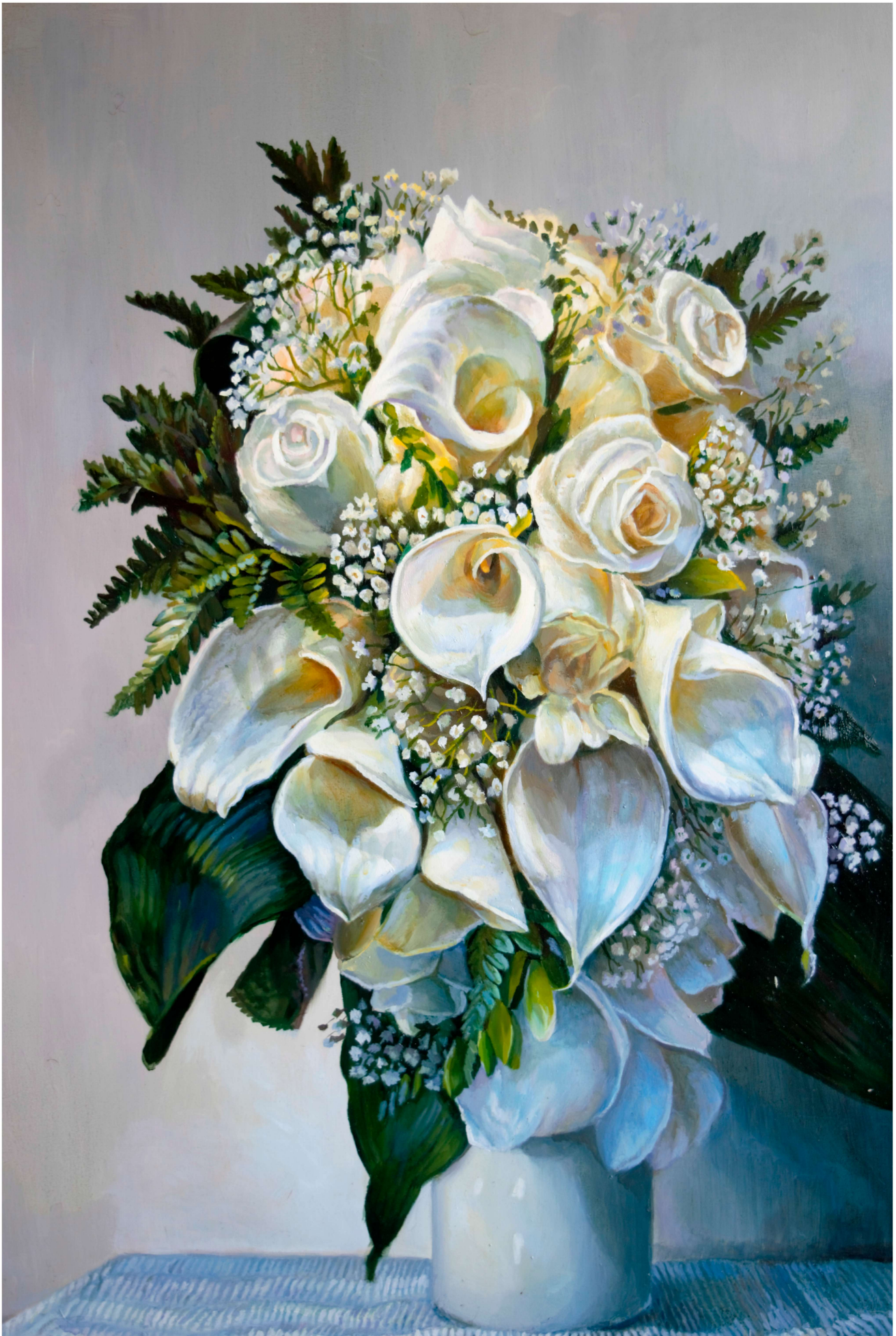
Calas óleo sobre tabla 100x81