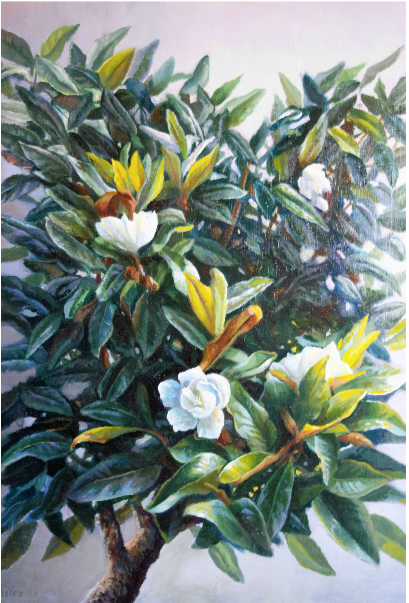
Azalea Óleo sobre tabla 100x81